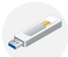
Mon lecteur USB