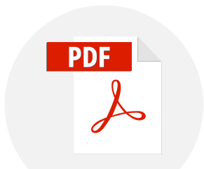
Mon document en PDF